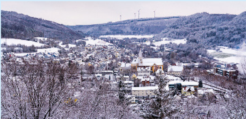
Winterzauber über Unterkochen