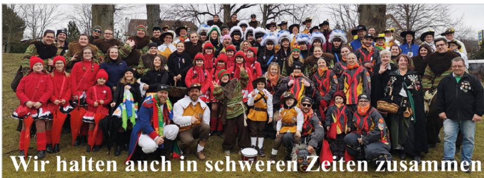
Wir halten auch in schweren Zeiten zusammen