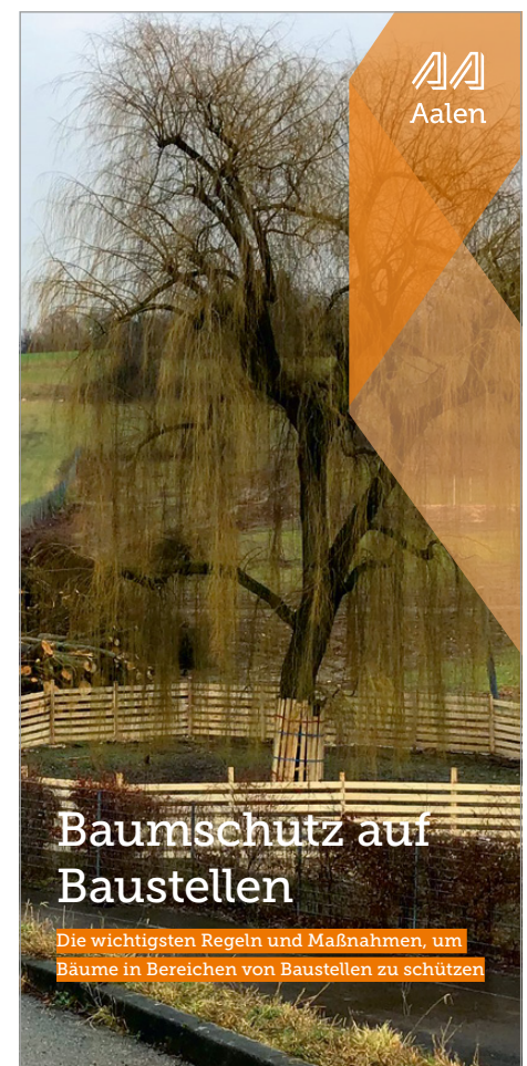
Info-Flyer „Baumschutz auf Baustellen“

„Deshalb ist es mir ein besonderes Anliegen, dass Bäume auf Baustellen geschützt werden. Dies trägt zu einem positiven Wohnumfeld und einer qualitativen Stadtentwicklung bei“, sagt Erster Bürgermeister Wolfgang Steidle.