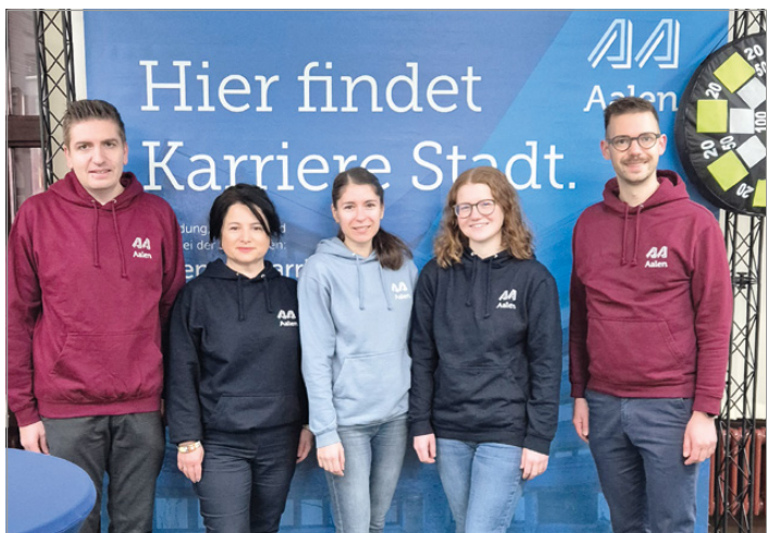
Vielfältige Perspektiven: Das Messeteam der Stadt Aalen informiert über Ausbildungs- und Studienmöglichkeiten.

Die Auszubildenden und Studierenden werden aktiv in die täglichen Aufgaben der Stadtverwaltung eingebunden und können ihr theoretisches Wissen direkt in der Praxis anwenden. Ein weiteres Plus ist die Übernahmegarantie nach erfolgreichem Abschluss: Wer gute Leistungen in