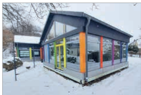
Neu sanierter Evang. Kindergarten „Schatzkiste“