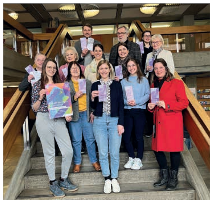
20 lokale Vereine und Akteur*innen beteiligen sich dieses Jahr am Programm.

Den digitalen Flyer gibt es unter: www.aalen.de/chancengleichheit