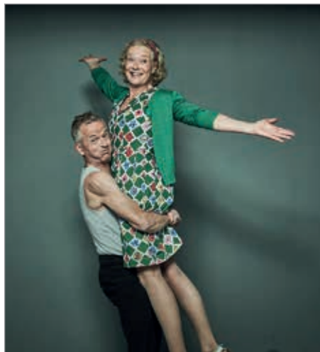
Szenenfoto: Was man von hier aus sehen kann.

Termin: Donnerstag, 14. März, 20.00 Uhr, Stadthalle Aalen. Karten gibt es für 15,00 Euro inkl. Ge- bühen und Garderobe im Vorverkauf in der Tourist-Information Aalen, unter Tel. 07361/52-2359 oder unter www.reservix.de . Die Veranstaltung ist Teil der Reihe Theaterring. Mehr Informationen unter www.aalen-kultur.de