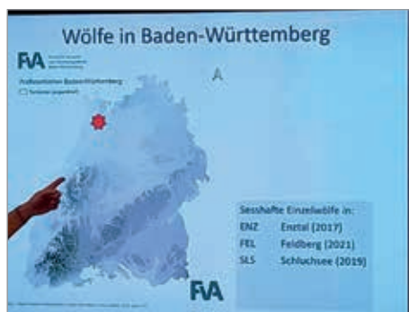
Wölfe in Baden-Württemberg

und zum Abschluss über die Wölfe in Baden-Württemberg.