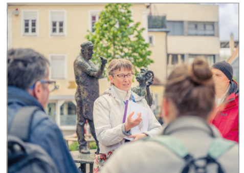
Stadt- und Themenführungen in Aalen.

Alle öffentlichen Termine sind buchbar unter www.aalen.de/entdecken sowie in der Tourist-Information Aalen Reichsstädter Straße 1, 73430 Aalen, Tel. 07361/52-2358 oder tourist-info@aalens.de bzw. www.aalen-tourismus.de .