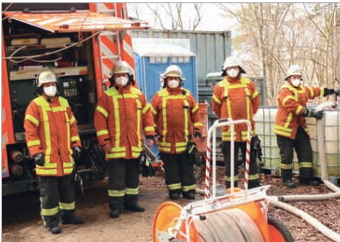
(Text und Bilder: INKO)