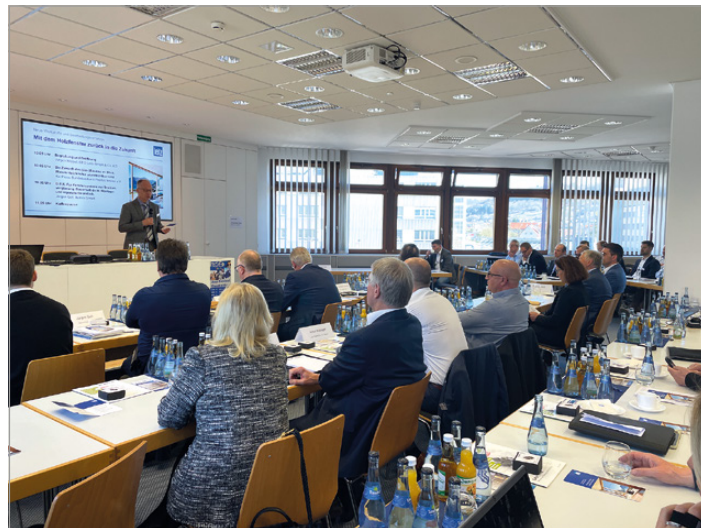
Die hohe Beteiligung unterstreicht die Relevanz des Themas Holzfenster. Das Leitz Symposium überzeugt erneut als fachlicher Impulsgeber und Treffpunkt der Branche.