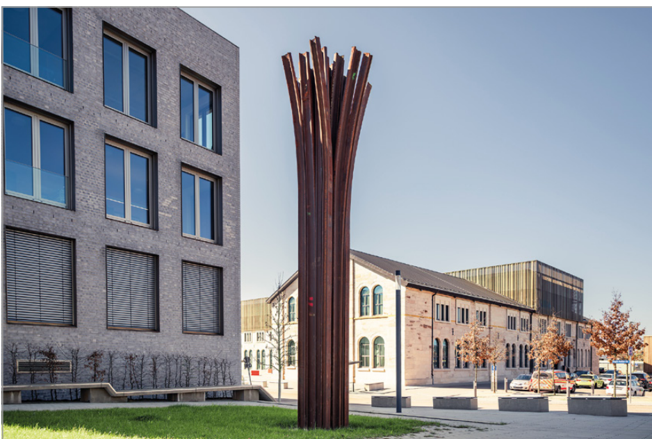
Bild: Eines der Kunstwerke: Die Aalener Säule von Jürgen Knubben.

Druckerei Zeller, Pfrommackerstraße 4, 73432 Aalen-Unterkochen Tel. 07361/88686 Fax 07361/88585 E-Mail: kobu@druckerei-zeller.de