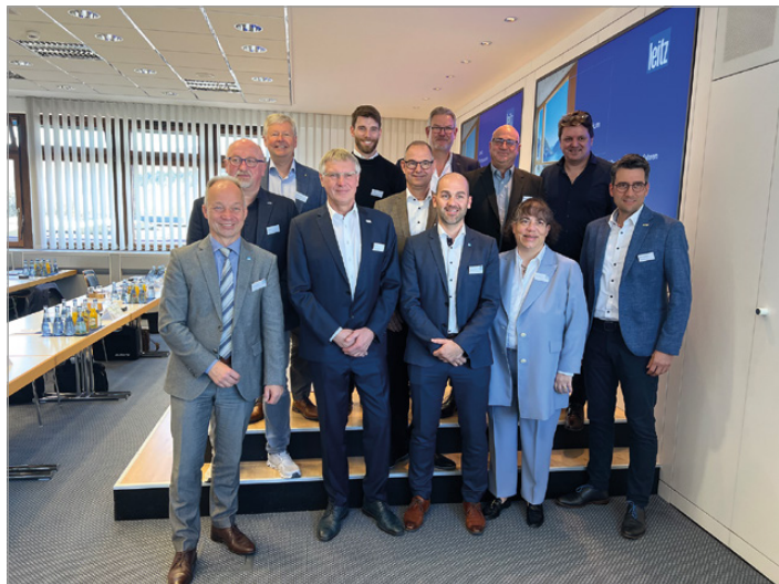
Praxisnahe Fachvorträge zum Thema „Mit dem Holzfenster in die Zukunft“ von Referenten aus unterschiedlichen Bereichen lockten 150 Teilnehmende aus der gesamten deutschen Holzfensterbranche nach Oberkochen.