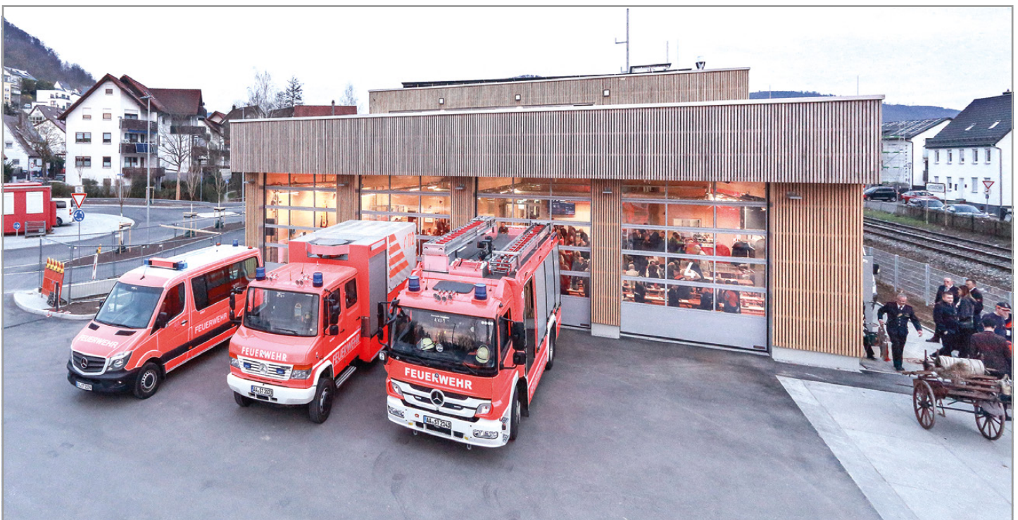
Die neue Feuerwache in Unterkochen.

Samstag, 10. Mai 2025, 11.00 bis 17.00 Uhr, Feuerwache Unterkochen (Aalener Straße 29, 73432 Aalen)