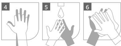
4 Zwischen den Fingern waschen 5 Seife abspülen 6 Hände sorgfältig abtrocknen