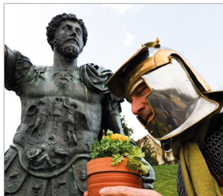
Kräuter- und Pflanzennutzung im römischen Militär (Symbolbild).

Auch die Schüler des Kopernikus-Gymnasiums Wasseralfingen sind als Bildungspartner des Limesmuseums mit von der Partie und bieten die Möglichkeit, einen eigenen Limes-