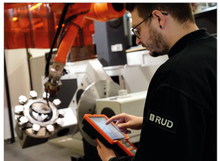
Moderne Fertigung und hohe Qualität prägen den Erfolg der RUD Gruppe.

Die Studie basiert auf einer Kombination aus repräsentativen Bevölkerungsbefragungen und einer KI-gestützten Analyse von Millionen Online-Daten. Dabei wurden unter anderem Vertrauen, Servicequalität, Nachhaltigkeit und die allgemeine Wahrnehmung von Unternehmen bewertet.