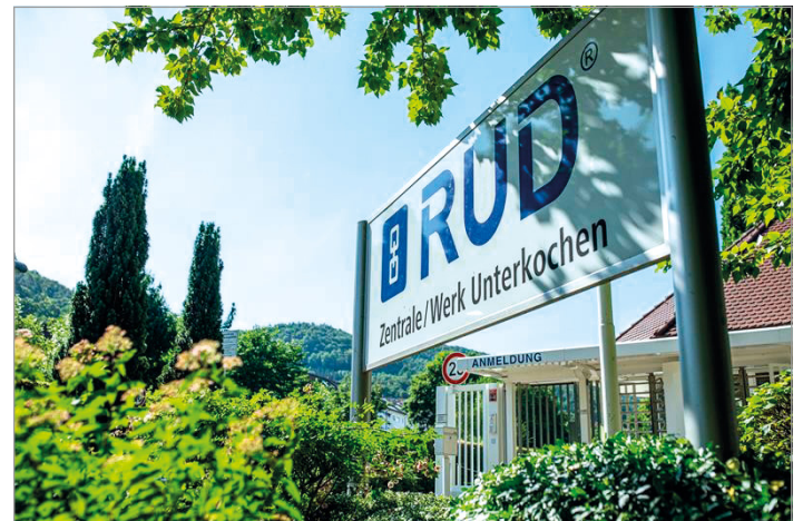
Der Stammsitz der RUD Gruppe in Aalen-Unterkochen: Das Familienunternehmen wurde als „Champion der Jahres 2026“ ausgezeichnet.

Für die Region ist die Ehrung zugleich ein starkes Signal: Ein traditionsreiches Unternehmen aus Ostwürttemberg behauptet sich erfolgreich auf internationalem Parkett – und bleibt dabei fest mit seiner Heimat verbunden.