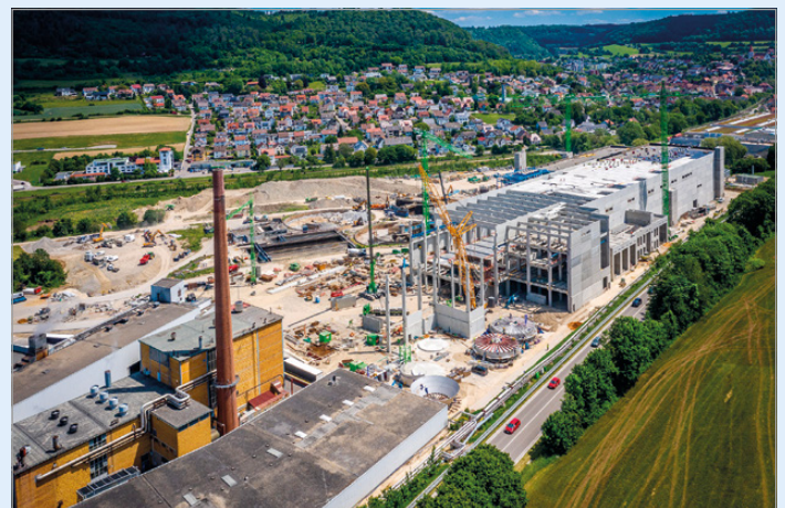
Gewaltig sind die Ausmaße der neuen Halle.