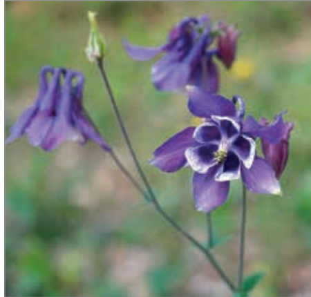
Akelei am Wegrand/Pilgerwanderung 2022

Ausdruck in den Gebeten, Liedern und Texten auf dem Weg. Es entstand eine schöne Weggemeinschaft und gute Gespräche über Gott und die Welt. Nächstes Jahr gerne wieder, dann vielleicht als Rundweg mit Start und Ziel am selben Ort. Merken Sie sich schon den Pfingstmontag um 10.00 Uhr dafür vor!