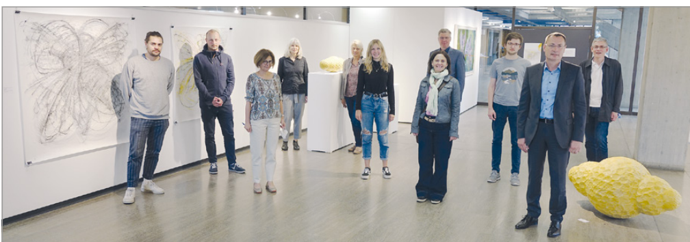
Zur Gründung des Fördervereins „Initiative Jugendkunstschule“ kamen die Mitglieder am 9. Juli im Rathaus zusammen.

Zum Ende der Sommerferien soll ein erstes Workshop-Angebot starten. Bei Interesse bitte unter jugendkunstschule@aal.de melden. Wer Mitglied im Förderverein werden möchte, bitte ebenfalls unter dieser Mail melden. Spendenkonto: DE46 6149 0150 0426 5980 08 bei der VR-Bank Ostalb eG