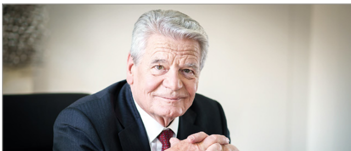
Bundespräsident a. D. Joachim Gauck kommt am 30. September in den KUBAA nach Aalen.