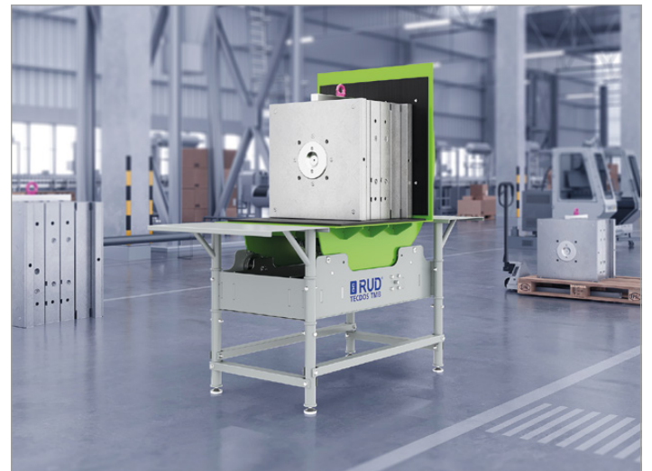
Der neue patentierte Wendetisch RUD TECDOS TMB.