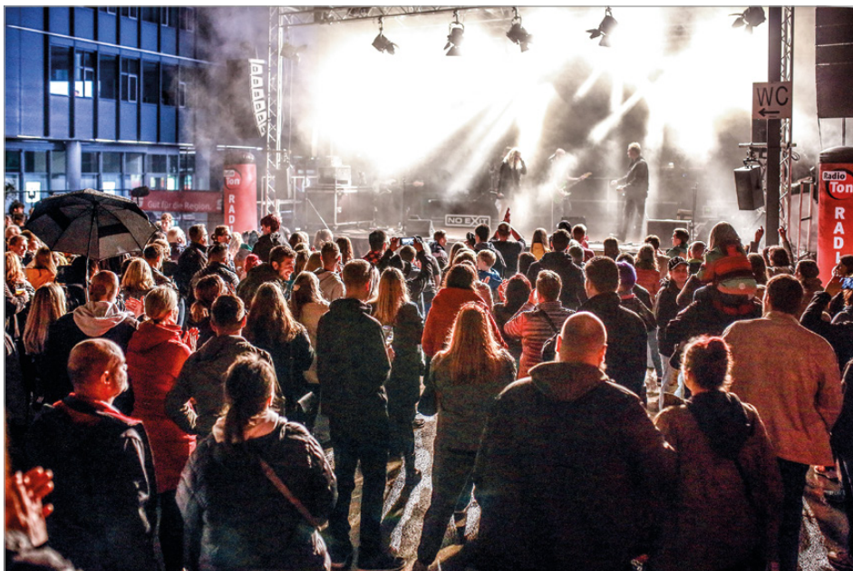
Auch dieses Jahr treten wieder zahlreiche Bands an den Reichsstädter Tagen auf.

„Unsere Innenstadt hat so vieles zu bieten und an diesem Wochenende ganz besonders“, freut sich Citymanager Reinhard Skusa.