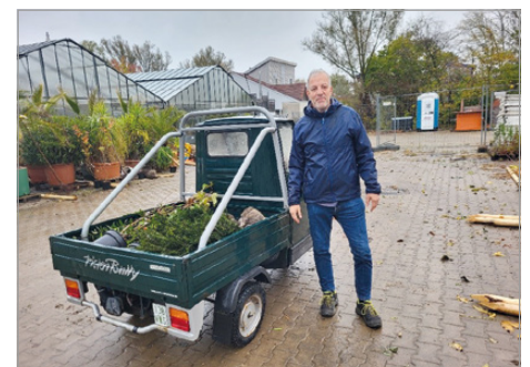
Abholung der Pflanzen in der Stadtgärtnerei im Herbst 2022.

Ein Antrag kann für Grundstücke gestellt werden, die sich in der Kernstadt von Aalen sowie in den Stadtteilen Dewangen, Ebnat, Fachsenfeld, Hofen, Unterkochen, Waldhausen und Wasseralfingen befinden. Die Förderrichtlinie legt außerdem fest, dass diese Grundstücke innerhalb von im Zusammenhang bebauten Ortsteilen und Splittersiedlungen sowie von Bebauungsplänen liegen müssen. Damit scheidet z.B. Feld- und Waldgrundstücke, Einzelgehöfte sowie die meisten Kleingartengrundstücke aus.