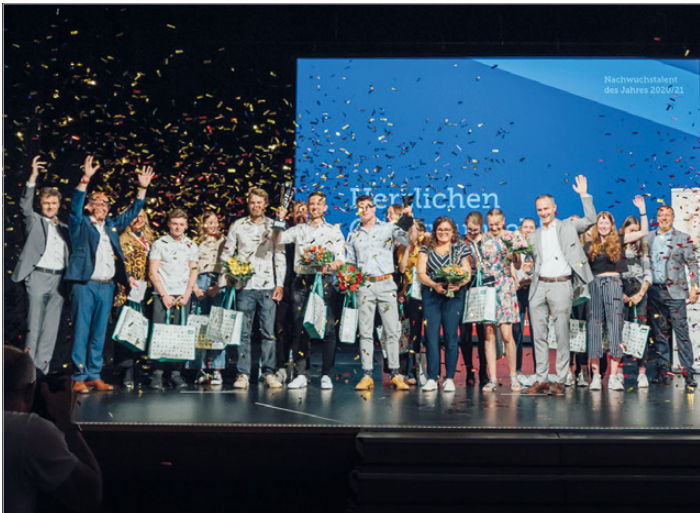
Das waren die Gewinner der 66. Sportlerehrung in diesem Jahr.

Die aktuellen Sportlehrungsrichtlinien und der Link zum Meldeformular können per E-Mail unter sportamt@aalen.de oder telefonisch unter 07361/52-1195 angefordert werden.