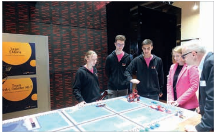
Text+ Bild: Sonja Fick

Auf die herausragenden Erfolge der LEGO-Robotiker ist die EAG-Schulgemeinschaft sehr stolz. Wir gratulieren!