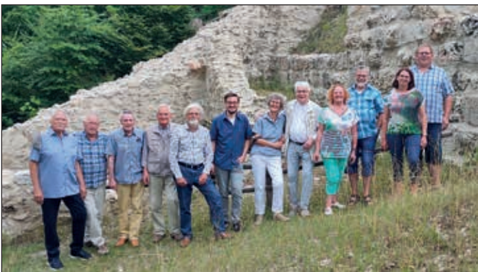
Gruppenbild der INKO auf der Kocherburg.

Der Preis wird durch das Deutsche Nationalkomitee für Denkmalschutz ausgelobt. Jedes Bundesland darf dazu 2 Vorschläge einreichen. Die INKO wurde durch das Denkmalamt Baden-Württemberg vorgeschlagen. Wir freuen uns sehr über diese Auszeichnung und bedanken uns herzlich bei allen, die uns über die Jahre praktisch, ideell und finanziell unterstützt haben. Durch den starken Rückhalt beim Vorstand unseres Heimatvereins, dem Geschichtsvereins Aalen e.V., ist es uns leichter gefallen, die auftretenden Schwierigkeiten zu meistern.