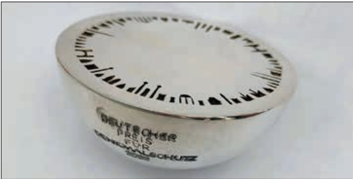
Deutscher Preis für Denkmalschutz 2023: die Silberne Halbkugel.