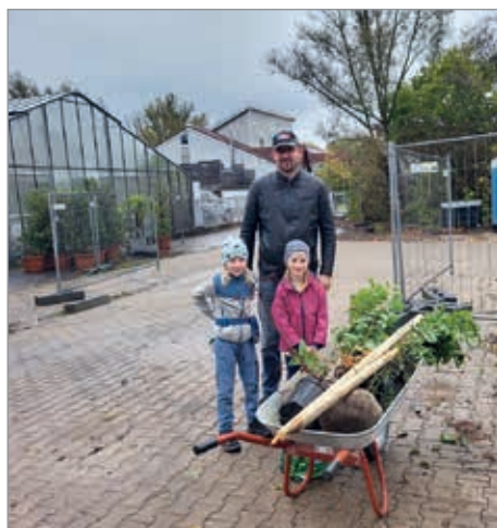
Abholaktion Herbst 2022

Hobbygärtner*innen mit Pflanz- und Pflagetipps für die Pflanzen sowie mit Pfählen und Stricken für eine sachgerechte Pflanzung ausgerüstet. Nach der Aktion ist vor der Aktion. Daher geht es bald wieder an die Vorbereitungen für die nächste Aktion im Frühjahr. Alle Infos hierzu können auf der städtischen Homepage unter www.aalen.de/baumpflanzungen nachgelesen werden. Wer direkt informiert werden möchte, sobald es mit der Aktion los geht und die neue Sortenliste für das Frühjahr zur Verfügung steht, kann sich gerne bereits jetzt bei Alena Röhrich ( gruenflaechenamt@aalen.de oder Tel. 07361/52-1328) vormerken lassen.